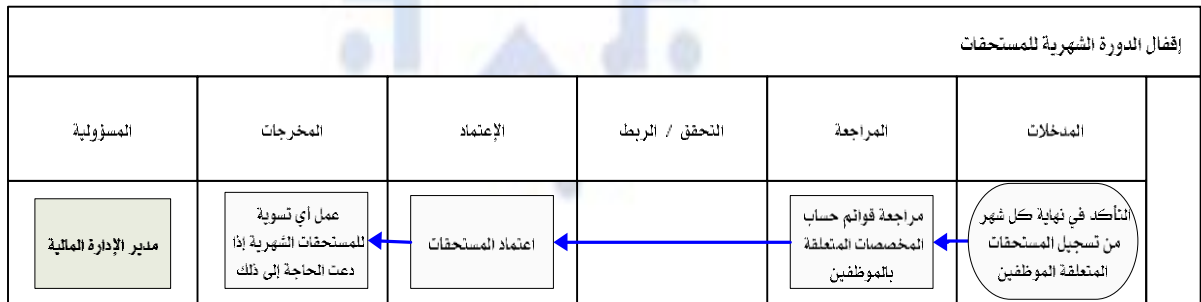
شكل رقم ٥ /

يوضح المخطط البياني التالي ( شكل رقم ٥) طريقة تسلسل العمل لإقفال الدورة الشهرية للمستحقات: